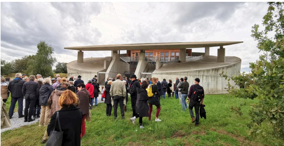
© Der Kunstraum will erwandert werden (hier: Raketensstation, Impression vom Inselfestival 2021) © Angela van den Hoogen

Die 20. Ausgabe des in der Nähe der alten rheinischen Stadt Neuss stattfindenden Festivals widmet sich narrativer Musik.